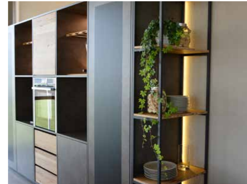
Schlichte Fronten – einfach zu reinigen und zu pflegen – mit Wandtafelblech zum Anbringen von Notizen und Nachrichten

Viel Luft und Raum um die eigene Kreativität einzubringen.