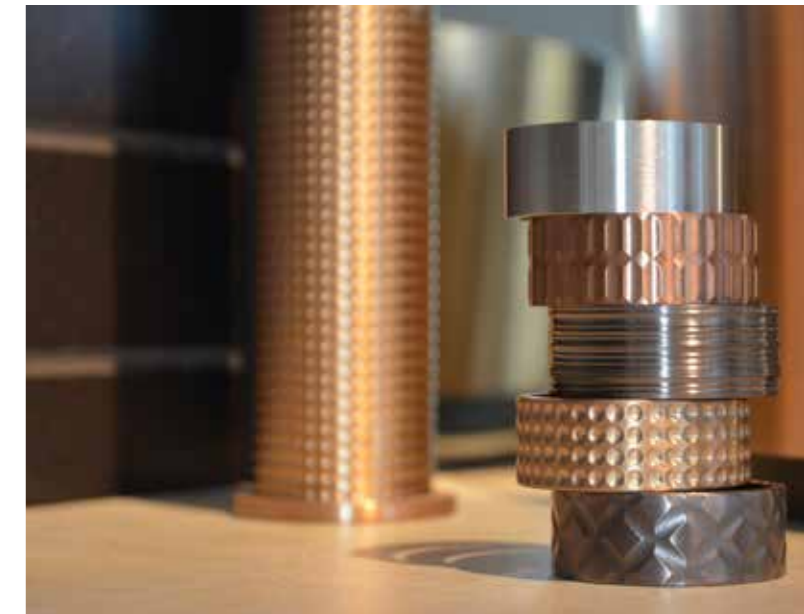
Unverkennbares Gessi-Ambiente in gold, chrom, messing oder kupfer, mit gebürsteter, glatter oder reliefartiger Oberfläche.

der Glasrückseite aufgebracht und mit einer dimmbaren Beleuchtung versehen. In Ihre Küche eingebaut, erhalten Sie so garantiert eine sehr individuelle Küche. Auch ein dekorativer Schriftzug oder ein Hand-Lettering kann als Vorlage für die Glasrückwand dienen.