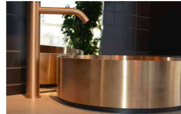
Armaturen werden zu Designobjekten

Der Erfolg von Gessi Armaturen begann mit einer revolutionären Idee: Die Verwandlung eines alltäglichen Produkts wie eine Armatur in ein Designobjekt mit gut durchdachten Funktionen. Nicht mehr die zweckmäßige Funktion der Armatur steht im Mittelpunkt, sondern das ästhetische und aus der Natur inspirierte Design. Vom Waschbecken über den Wasserhahn bis hin zu Dispenser und Accessoires werden vom italienischen Unternehmen Kollektionen angeboten, die ein unverkennbares Gessi-Ambiente in gold, chrom, messing oder kupfer sowie mit gebürsteter, glatter oder reliefartiger Oberfläche ins eigene Haus zaubern.